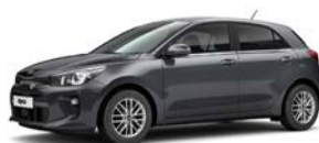
Platinum Graphite (ABT) metallic (pearleffekt)