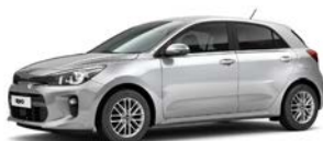
Silky Silver (4SS) metallic