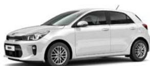
Clear White (UD) solid