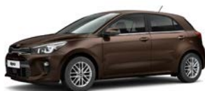
Deep Sienna Brown (SEN) metallic (pearleffekt)