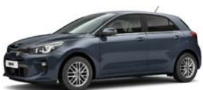
Smoke Blue (EU3) metallic (pearleffekt)