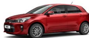
Signal Red (BEG) metallic (pearleffekt)