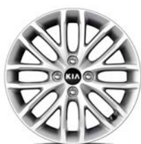
16 " aluminiumfälg (Advance)