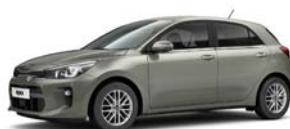
Urban Green (URG) metallic (pearleffekt)