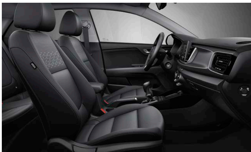
Svart interiör med svart tygklädsel