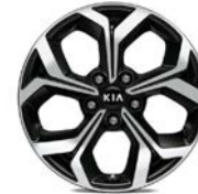
17 " aluminiumfälg (Advance)