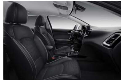
Svart interiör med svart artificiell delläderklädsel. Invändiga detaljer i matt aluminium- och blanksvart finish (Advance Plus)