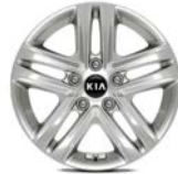
16 " aluminiumfälg (Action)