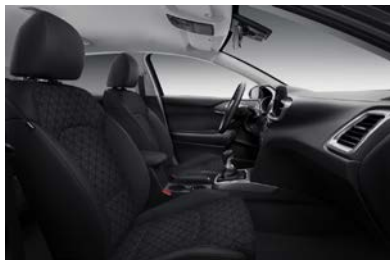
Svart interiör med svart tygklädsel. Invändiga detaljer i matt kromfinish (Action & Advance)